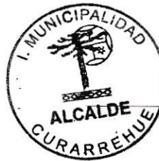
DANIEL PARRA CALABRANO ALCALDE