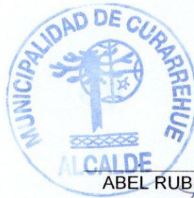
ABEL RUBEN PAINEILLO BARRIGA Alcalde Presidente Consejo Comunal de Seguridad Pública